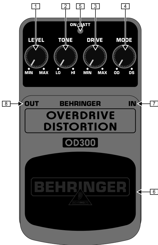
Обзор верхней части